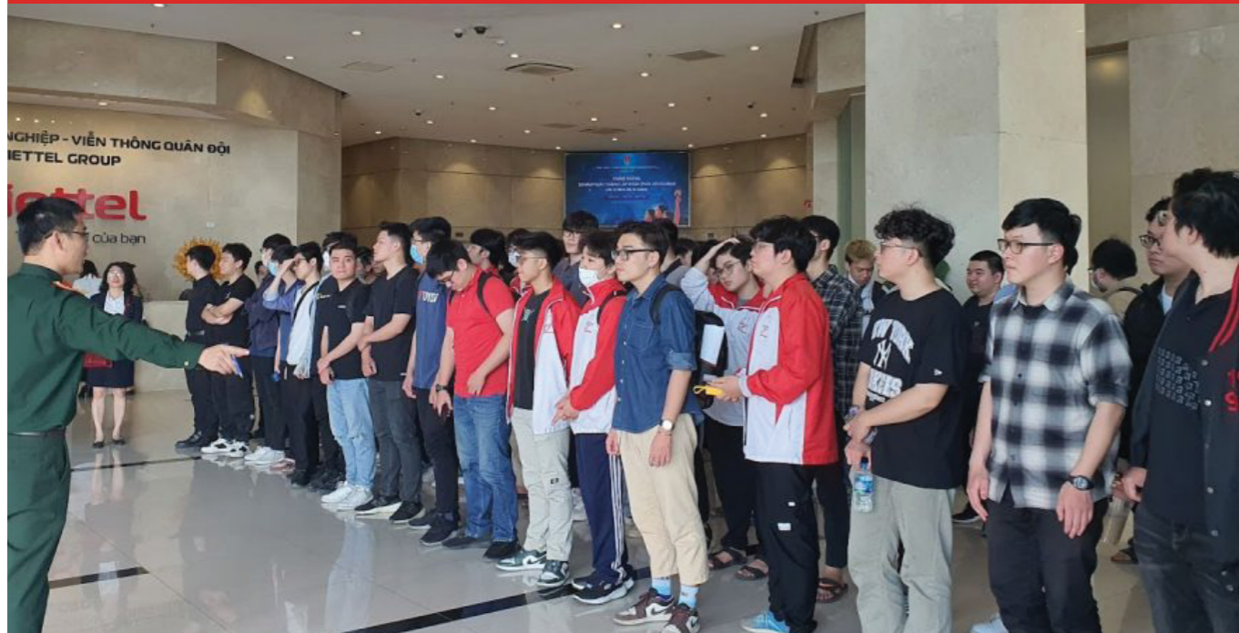
CÔNG TY VIETTEL CHIA SẺ VỚI SINH VIÊN VỀ CÔNG NGHỆ THỰC TẠI ẢO