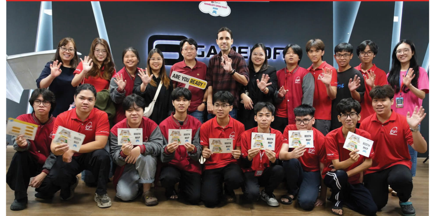
CÔNG TY GAMELOFT CHIA SẺ VỚI SINH VIÊN VỀ LĨNH VỰC PHÁT TRIỂN GAME