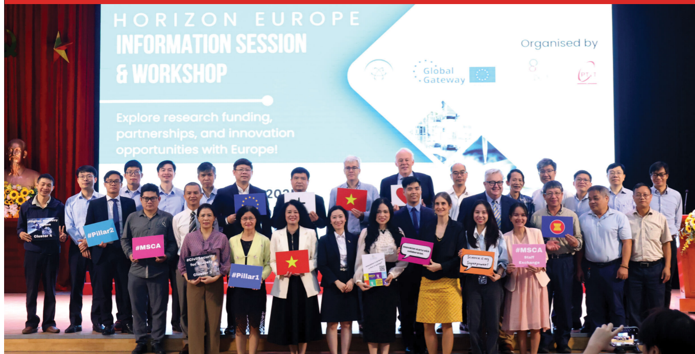
HỘI THẢO QUỐC TẾ VỀ CƠ HỘI HỢP TÁC NGHIÊN CỨU VỚI EU