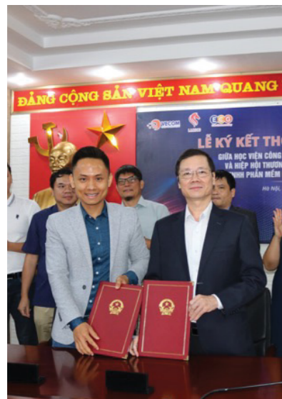
Ký thỏa thuận hợp tác giữa PTIT với Hiệp hội TMĐT Việt Nam và các doanh nghiệp TMĐT