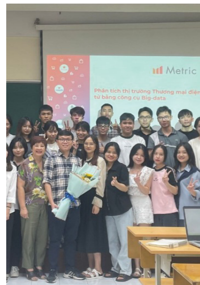
Chuyên gia TMĐT trực tiếp giảng dạy