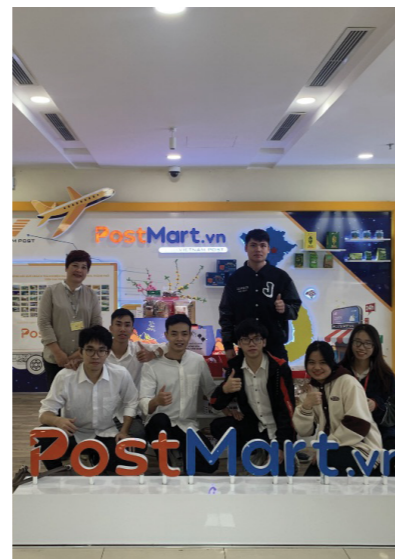
Sinh viên thực tập tốt nghiệp tại doanh nghiệp TMĐT